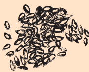
British Grown Linseed