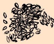
British Grown Linseed