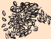
British Grown Linseed