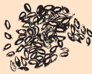
British Grown Linseed